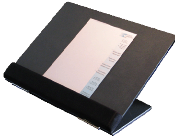
EDHCH6015 : Format légal